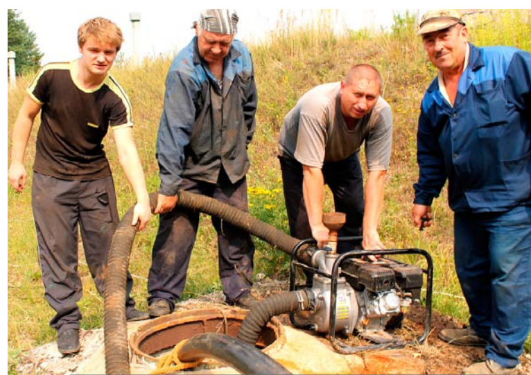
Водозабор «Лесной». Бригада слесарей-ремонтников выполняет работы на скважине

- Качество воды в центральной части города несколько хуже, чем на Пионерном. Дело в том, что водоснабжение этих жилых массивов осуществляется от разных водозаборов. Город питается от скважин, расположенных в городском парке, Пионерный — от водозабора «Лесной». Химический состав воды в этих скважинах отличается. В водозаборе «Парковые» содержание окиси железа больше, чем на «Лесном». В этом году мы почистили два городских резервуара, каждый объемом 600 куб.м. Проведем другие мероприятия по улучшению качества воды. На одной емкости водозабора «Лесной» такие рабо-